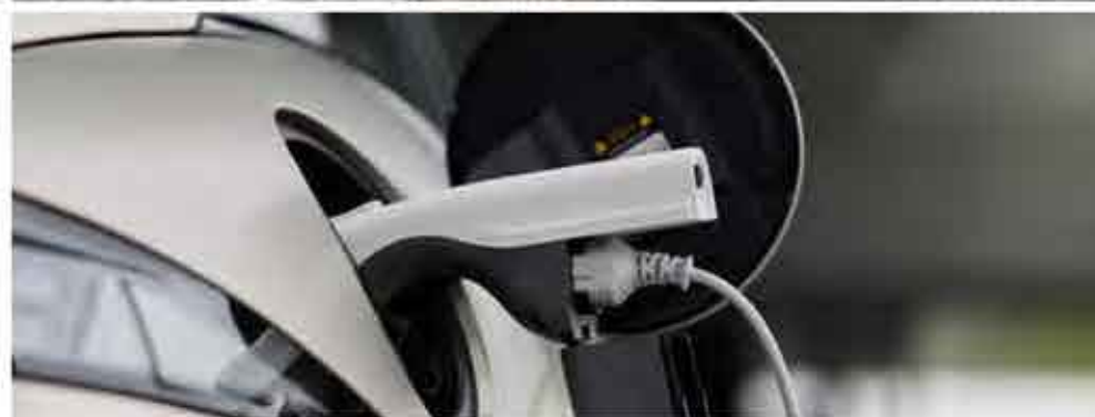
Chargeur inversé (V2L)

V2L est la fonction innovante de IONIQ 6 qui vous permet de brancher des appareils électriques sur une prise de courant depuis l'intérieur ou l'extérieur de votre voiture. Le courant électrique général (230V/120V) est fourni à l'intérieur et à l'extérieur. Vous pouvez utiliser 3,6 kVA pour les appareils électriques de 230 V et 1,9 kVA pour les appareils électriques de 120 V.