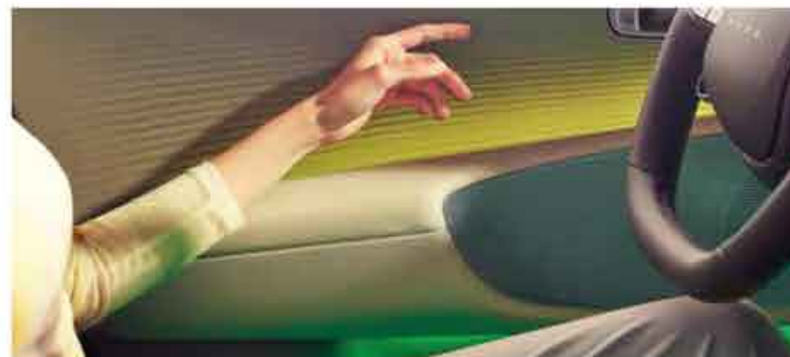
Contreportes sans boutons & éclairage d'ambiance bicolore

Les boutons ont été déplacés sur la console centrale, offrant ainsi plus d'espace et de rangement/ Les lumières d'ambiance bicolores installées dans les contreportes supérieures et inférieures peuvent être sélectionnées parmi 64 couleurs ou six thèmes bicolores pour s'adapter à l'humeur du conducteur.