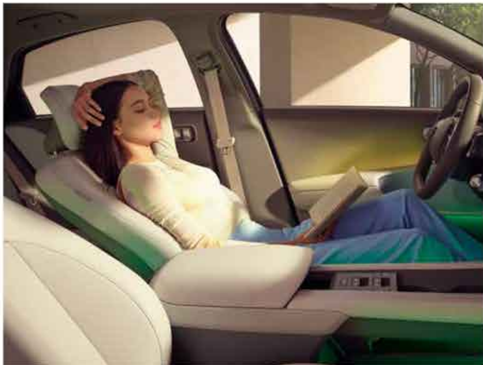
Siège confort relaxant (1ère rangée)

Découvrez la vaste gamme de fonctions pratiques de IONIQ 6.