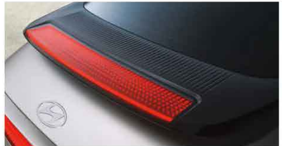
Feux de stop à pixels paramétriques