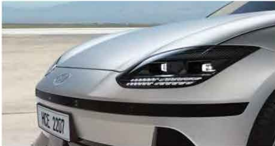
Feux avant LED à pixels paramétriques

L'esthétique et le fonctionnel se mêlent harmonieusement dans la silhouette épurée de IONIQ 6. Son design aérodynamique unique minimise la résistance à l'air, ce qui permet une conduite souple et dynamique.