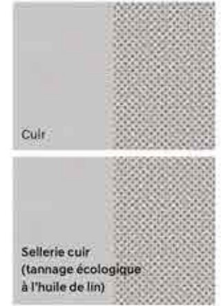
Intérieur Gris clair