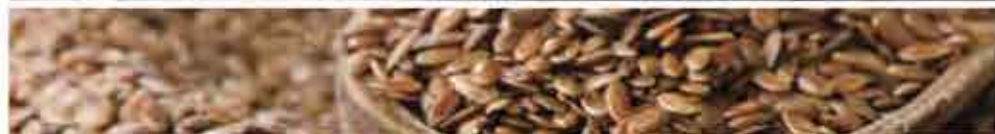
Tissu PET recyclé et composants d'origine végétale.

Le cuir utilisé pour les sièges est tanné de manière écologique et teint à l'huile de lin.