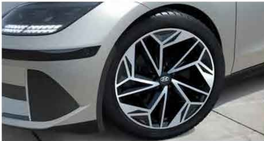
Jantes en alliage de 20 pouces