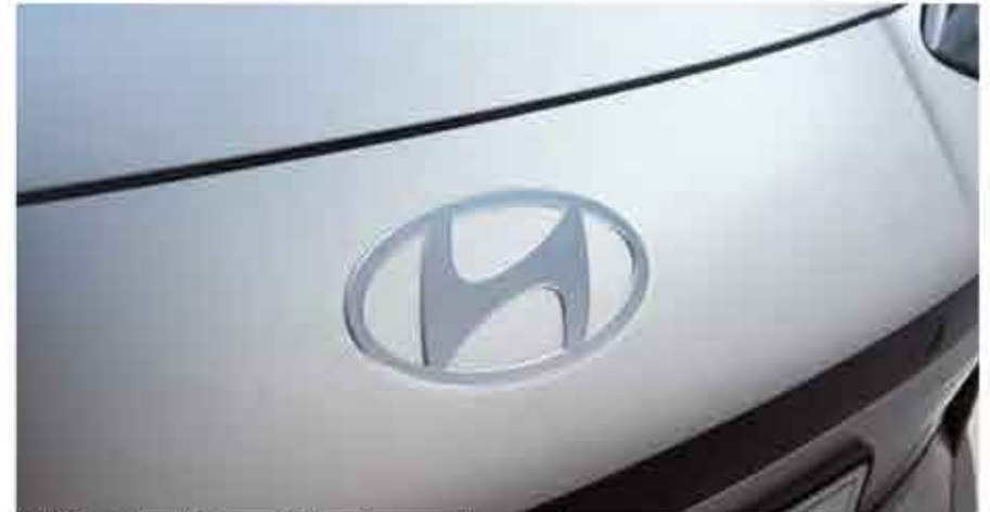
Emblème Hyundai incrusté dans le pare-chocs avant