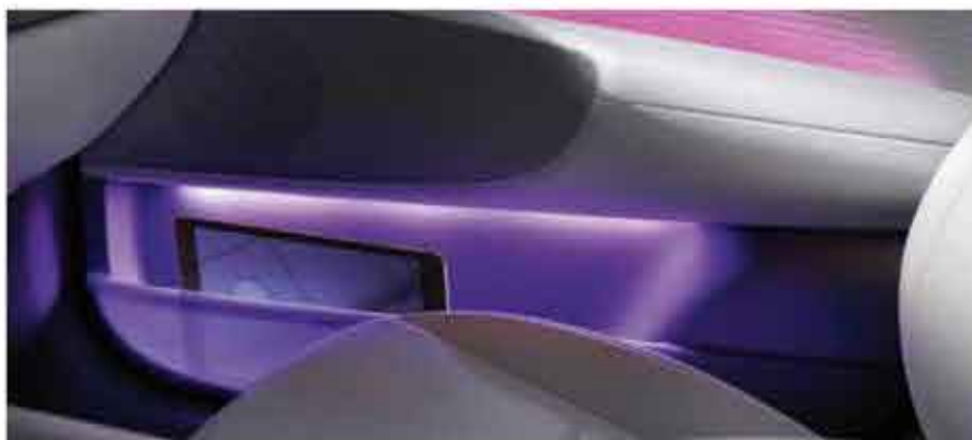
Matériaux transparents & rangements intérieurs