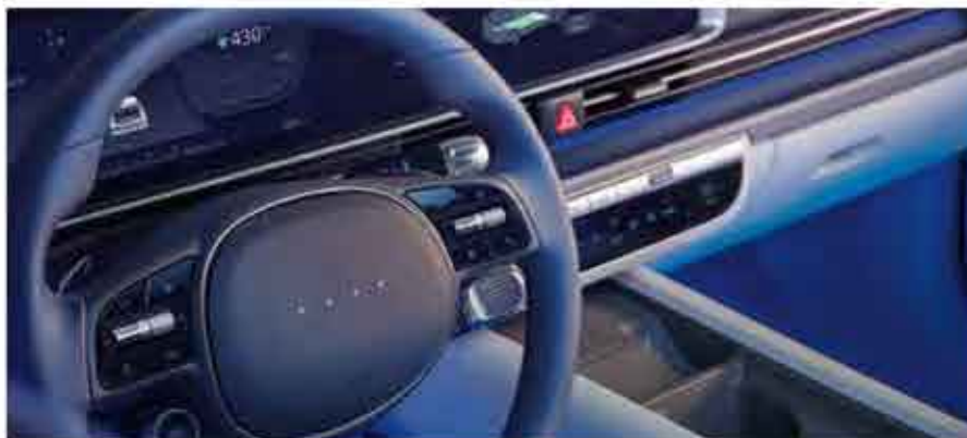
Lumières Pixel & LED interactives

L'intérieur en forme de cocon offre un espace confortable et spacieux, une architecture et des caractéristiques pensées pour l'utilisateur.