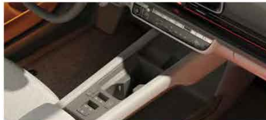
Console centrale type «Cockpit»

Le volant interactif doté de quatre pixels LED et les LED sur le tableau de bord indiquent le statut de différentes fonctions du véhicule.. (Bienvenue/ Au revoir, reconnaissance vocale etc.)