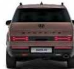
Voie arrière (roue - 533 mm) 1 653