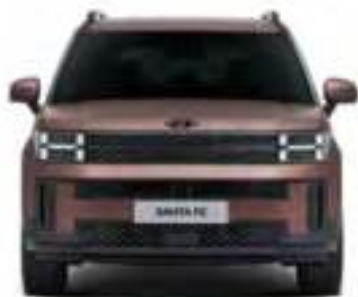
Largeur totale (roue - 533 mm) 1 643 Voie avant 1 900