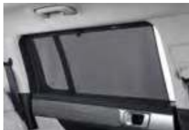
Pare-Soleil pour vitres latérales arrière