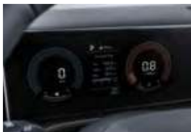
Tableau de bord LCD 4.2/12.3