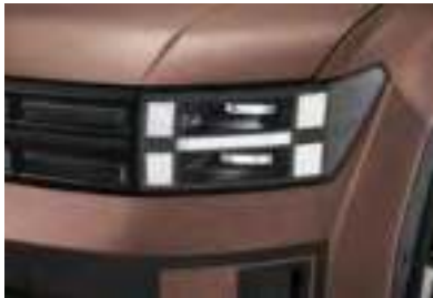
Phare à LED (Type projection)