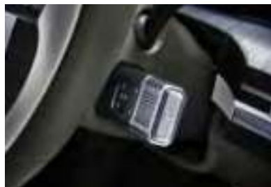
Palettes au volant