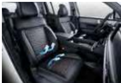
Sièges avant chauffants et ventilés