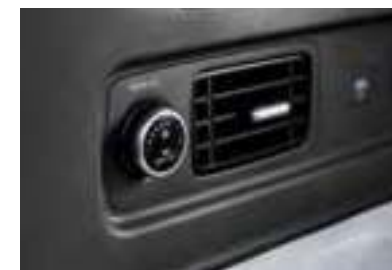
Climatisation trois zones