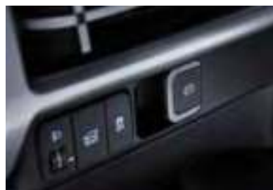
Frein de stationnement électrique