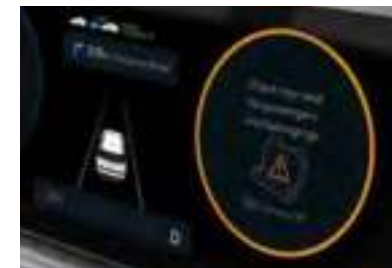
Alerte passager arrière