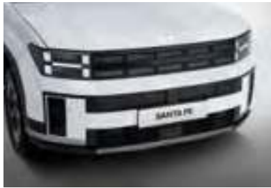
Radiateur et Grille d'admission