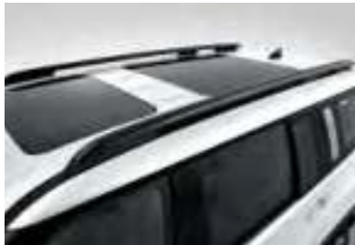
Barres de toit longitudinales / Double toit ouvrant panoramique