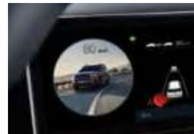
Surveillance des angles morts