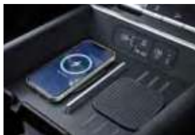
Chargeur smartphone à induction