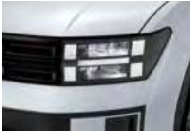
Phares à LED (Type MFR)