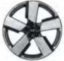
Jantes alliage 20" (en option)