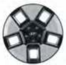
Jantes alliage 18" (Hybride)