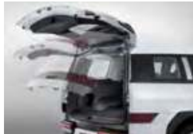
Système de hayon intelligent