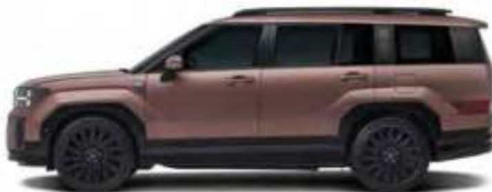
Longueur 2 815 Empattement 4 830