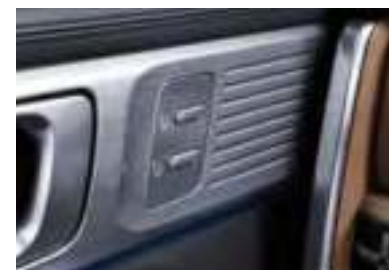
Système de mémoire intégré