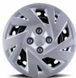
Jantes acier 14" avec enjoliveurs