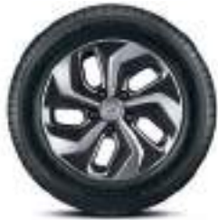
Jantes alliage 16"

En combinant un moteur à essence à injection directe spécialement développé pour l'usage hybride et un moteur électrique alimenté par batterie, le nouveau Kona Hybrid offre une dynamique exemplaire doublée d'un rendement énergétique inégalé. Et ce, tout en vous garantissant des performances exceptionnelles, dont une puissance combinée de 141ch pour un couple de 265 Nm. Ajoutez à ces prestations d'exception une transmission à double embrayage et une structure de caisse allégée hautement résistante, et vous obtenez une expérience de conduite incomparable.