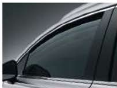
Fenêtre automatique de sécurité (côté conducteur seulement)