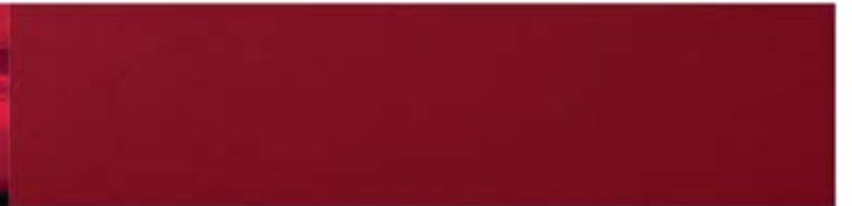
Rouge horizon (RD2)