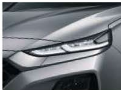
Feux de jour à LED (DRL)