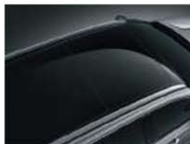
Toit ouvrant panoramique