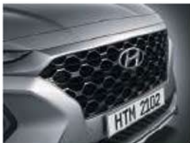
Grille de calandre