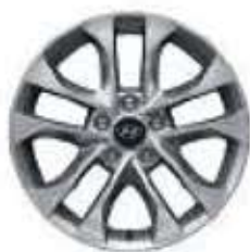
Jantes en alliage 17"