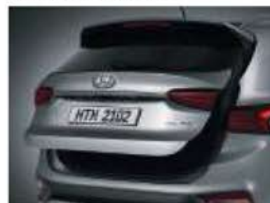
Système d'ouverture de coffre automatique