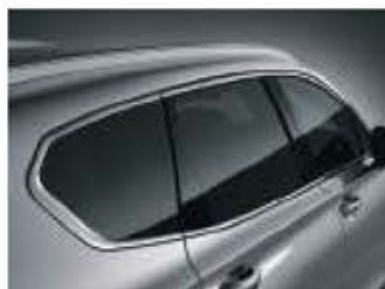
Moulage de ceinture de caisse