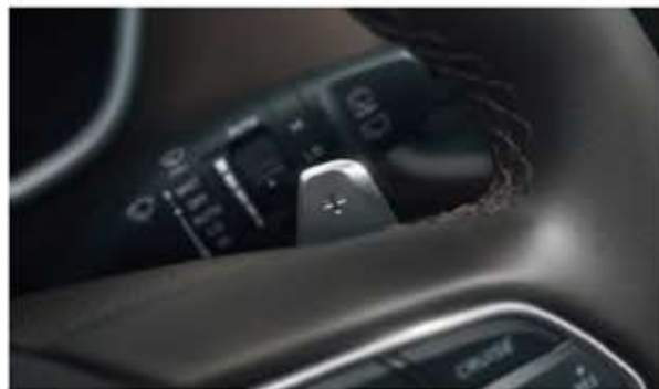
Levier de vitesse