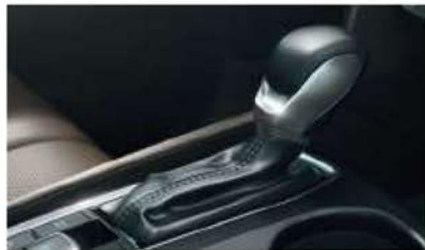
Transmission automatique à 8 vitesses