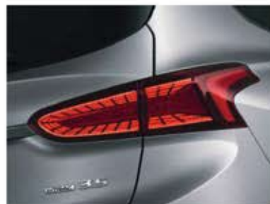
Feux de position arrière à LED