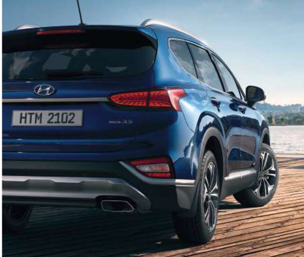
Feux arrière à LED / Feux antibrouillards arrière à LED