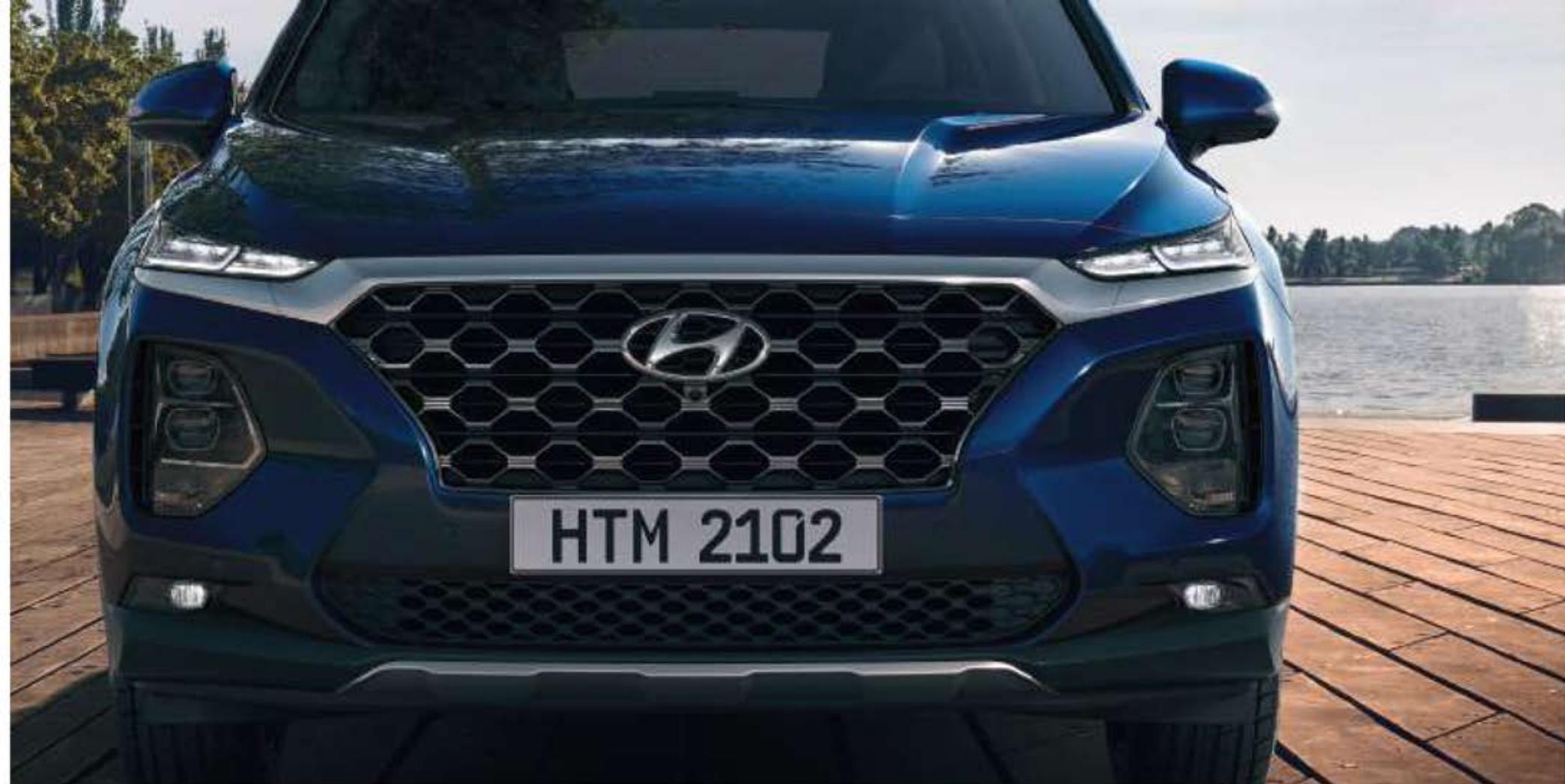
Grille de calandre / Feux de jour à LED (DRL) / Feux avant à LED / Feux antibrouillard à LED