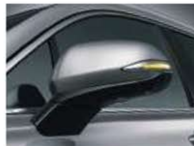
Répétiteurs de clignotants à LED intégrés aux rétroviseurs extérieurs