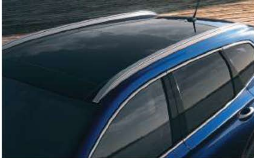
Porte-skis de toit / Garniture latérale