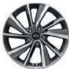
Jantes en alliage 18"