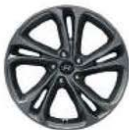
Jantes Dark Hypersilver 19"