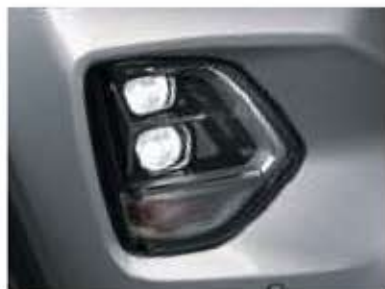
Feux avant à LED